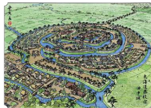
17世紀前半頃の田中城 (東海道鳥瞰名所絵図 栗原昌司画)