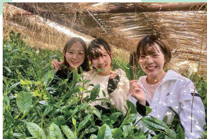
朝比奈地域では高級品種「玉露」が栽培されている