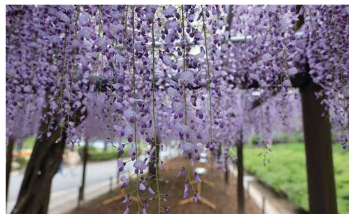
市の花は「藤」で、各所で見られる。写真は蓮華寺池公園

静岡県の中央に位置し、地形は南北に長い藤枝市。北部は赤石山系のふもとに接して自然豊かで、南部には肥沃な志太平野が広がっています。平坦と起伏に富んだ地勢を併せ持っていますので、散歩のように市内を巡るポタリングや、長い距離を走るロングライド、坂道を走るヒルクライムなど、みなさんの好みに合わせたサイクリングを楽しめます。