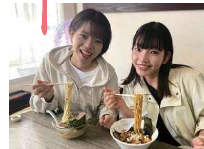
「温」と「冷」の2種類の「朝ラー」を楽しむのが藤枝流

藤枝の食文化の一つ「朝ラー」。お茶の取引き等で早朝から働いていた多くの人に向けて、お店がラーメンを提供したのが始まりといわれています。市内には朝早くから営業しているお店が10店舗以上あります。