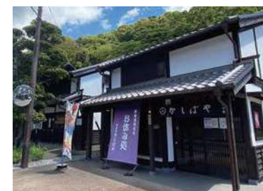
岡部宿～藤枝宿の距離は約7km。自転車なら30分ほどで両方とも回れる

東京と名古屋の中間に位置する藤枝市は、古くから交通の要衝として発展し、江戸時代には東海道の宿場町として栄えました。東海道21番目の岡部宿、22番目の藤枝宿があり、現在も当時とあまり変わらない町筋や面影が残っています。