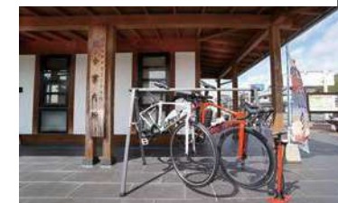
岡部総合案内所のえだピット

ふじえだバイシクルピットとは、自転車の空気入れや修理工具、休憩場所を備えたお店や施設のこと。気軽に立ち寄ってみよう。