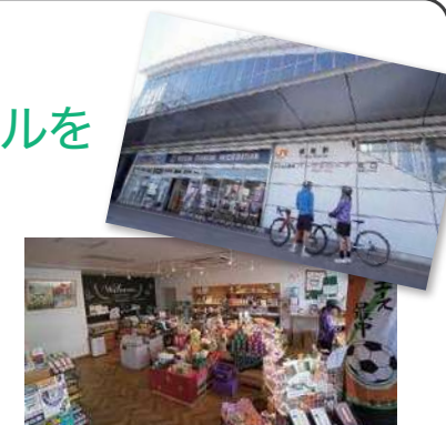
藤枝駅前にある藤枝市観光案内所

電動アシストの小径自転車4台を用意。貸出時間は9:00～17:00。料金600円/1日